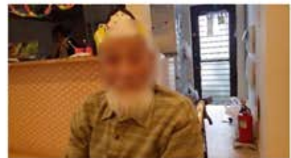
ご長者は福なので内に居りました