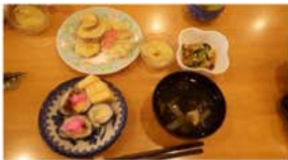
恵方巻き みんなで美味しく頂きました