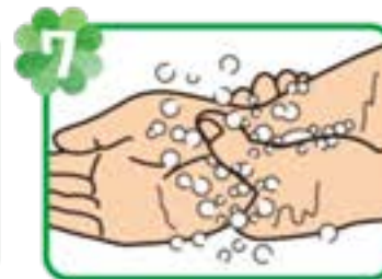
7 両手首までていねいに もみ洗う