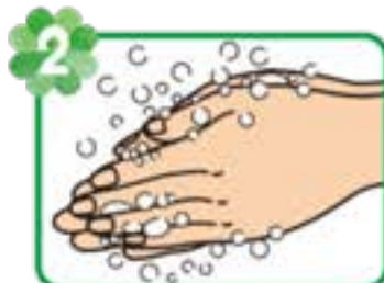
2 石けんをつけ、手の平を 擦り合わせてよく泡立てる