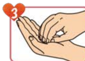
3 指先、指の背を反対の手 の平で擦る(反対の手も)