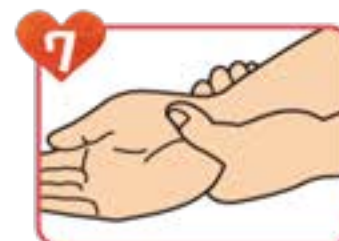
7 両手首まで ていねいに擦る