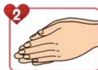
2 手の平と手の平を 擦り合わせる