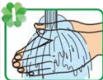
1 手指を流水でぬらす