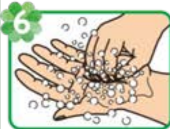
6 指先をもう片方の 手の平でもみ洗う (反対の手も)