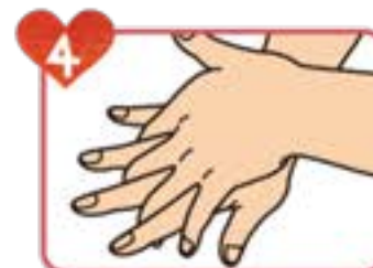
4 手の甲を反対の手の平で 擦る(反対の手も)