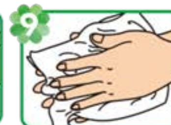
9 よく水気を拭き取る