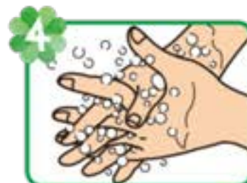
4 指を組んで両手の 指の間をもみ洗う