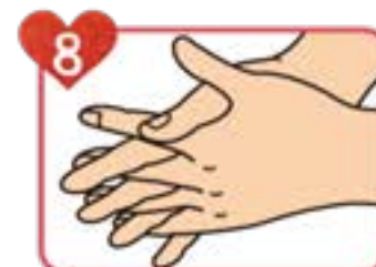
8 乾くまで擦りこむ