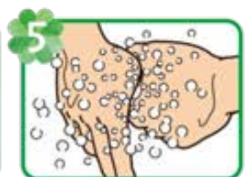
5 親指をもう片方の手で 包み、もみ洗う (反対の手も)