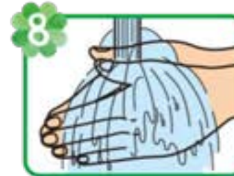
8 流水でよくすすぐ