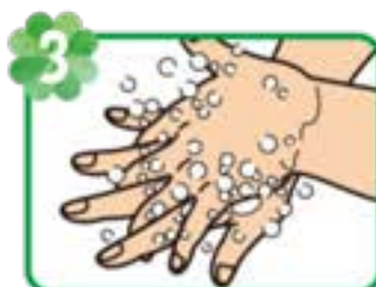
3 手の甲を反対の手の平で もみ洗う(反対の手も)