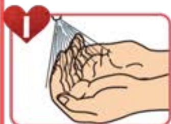
1 アルコール消毒液を 適量手に取る