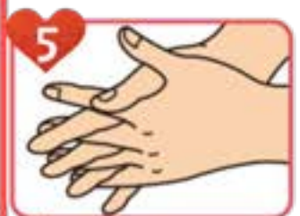
5 指を組んで両手の 指の間を擦る