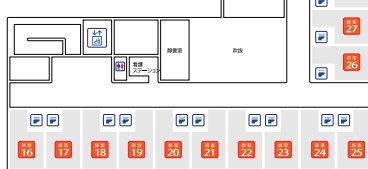
◆居室 30室 / 総面積: 14.75㎡ (居住: 12.32㎡・トイレ: 2.43㎡)