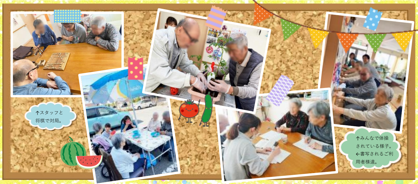
↑スタッフと 将棋で対局。