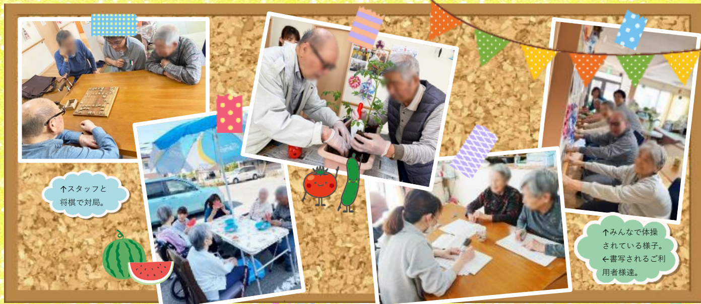
↑スタッフと 将棋で対局。