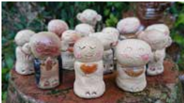
※ご利用者が陶芸教室で作った作品です。