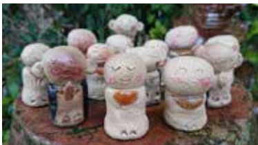
※ご利用者様が陶芸教室で作った作品です。